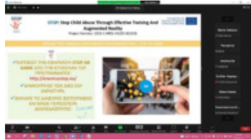
Πιλοτική δοκιμή στην Κύπρο

Τα εν λόγω εργαστήρια, στις περισσότερες περιπτώσεις, πραγματοποιήθηκαν στο πλαίσιο των εκδηλώσεων διάδοσης αποτελεσμάτων κάθε οργανισμού-εταίρου. Κύριο αντικείμενο των εκδηλώσεων ήταν η παρουσίαση των αποτελεσμάτων του έργου σε εργαζόμενους/ες στον τομέα της νεολαίας, νέους/ες, εκπαιδευτικούς και λοιπούς ενδιαφερόμενους.