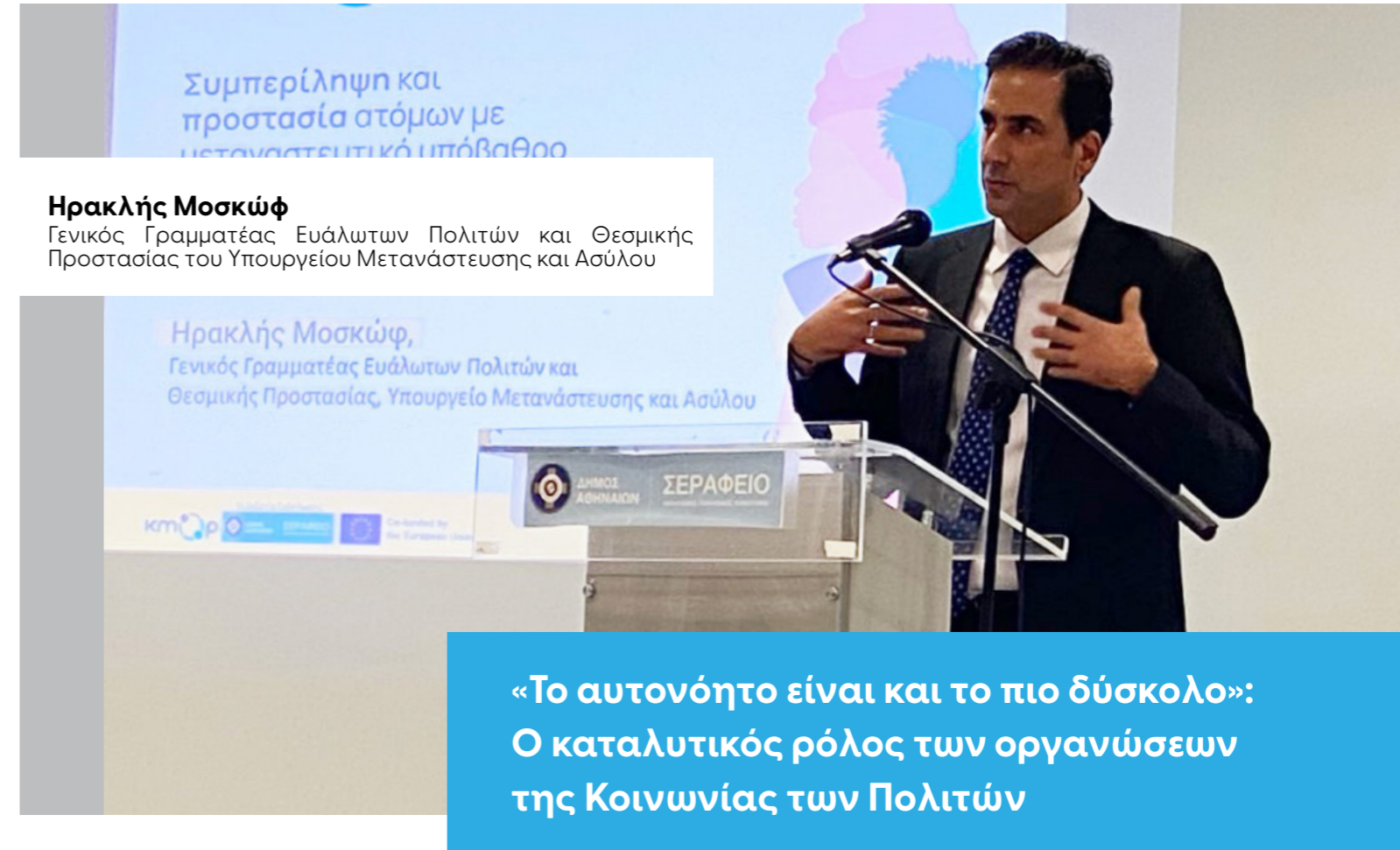
Ηρακλής Μοσκώφ Γενικός Γραμματέας Ευάλωτων Πολιτών και Θεσμικής Προστασίας του Υπουργείου Μετανάστευσης και Ασύλου

Εισαγωγική ομιλία στην εκδήλωση πραγμα-τοποίησε ο Ηρακλής Μοσκώφ , Γενικός Γραμματέας Ευάλωτων Πολιτών και Θεσμικής Προστασίας του Υπουργείου Μετανάστευσης και Ασύλου, ενώ χαιρετισμό απηύθυνε και ο Γιάννης Παπάς , Επικεφαλής Προγραμμάτων στο ΚΜΟΠ.