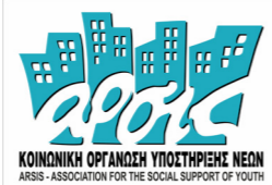
Αγγελική Σηφάκη, Έλιξ